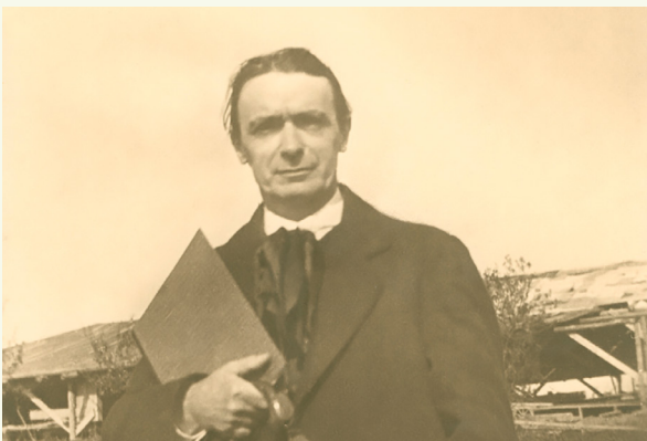
Foto: Rudolf Steiner 1921 in Dornach