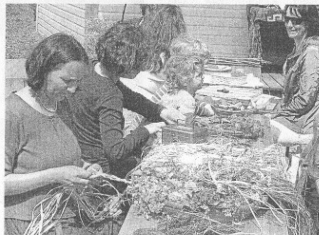
Viele kreative Möglichkeiten bot das Frühlingsfest des Kindergartens Hollerbusch.

Plätze gebe. Sie bedauerte, dass die Besucherzahlen im Vergleich zum Vorjahr gesunken seien. „Grund hierfür sind wahrscheinlich die vielen Konkurrenzveranstaltungen. Dennoch sind wir mit der Resonanz zufrieden“.