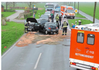
Auf der K3 kam es am Samstag zu einem schweren Unfall. Die Straße musste eine Stunde gesperrt werden.