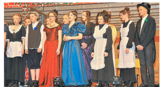
Liebevoller Kostüme gaben der Theateraufführung einen weiteren optisch gelungenen Anstrich, so dass es eine rundum gelungene Präsentation wurde.